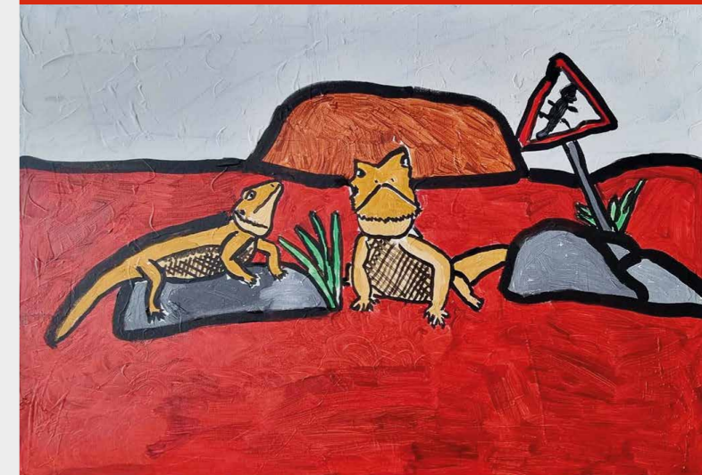
Angelina Vetter, Bartagamen-Pärchen in Australien